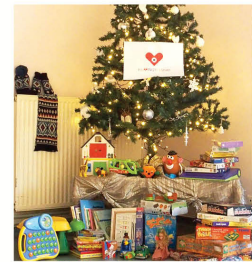
Résidence Les Vergers (90)