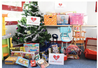
Direction Générale (25)