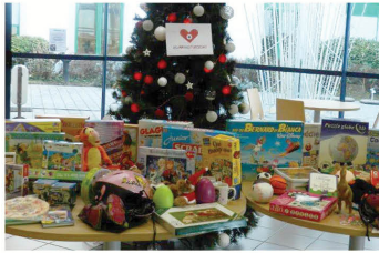
CMPR Bretegnier (70)