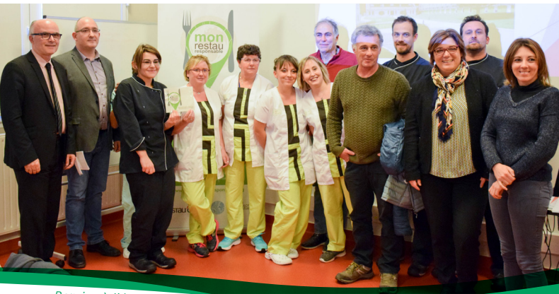
Remise à l'équipe du CRCP de Franche-Comté du label "Mon Restau Responsable"

Le Centre de Réadaptation Cardiolgique et Pneumologique "La Grange-sur-le-Mont" à Pont d'Héry (39) s'est lancé dans un projet de réduction du gaspillage alimentaire et de valorisation des déchets. Il obtient la garantie « Mon Restau Responsable » avec le soutien technique de Restau'Co.