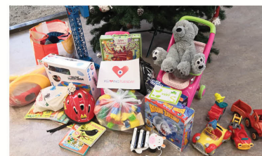
La Mosaïque (70)