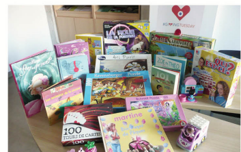
La Maison Blanche (90)

La Fondation Arc-en-Ciel s'est associée au mouvement mondial « Giving Tuesday », qui célèbre et encourage la générosité, l'engagement et la solidarité. Les jouets collectés ont été remis aux enfants au moment de Noël faisant de nombreux heureux.