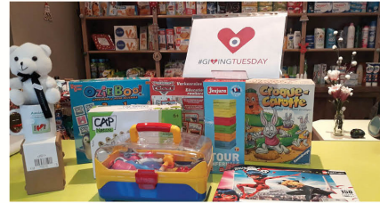
CRCP «La Grange-sur-le-Mont» (39)