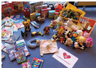
Résidence Surleau (25)