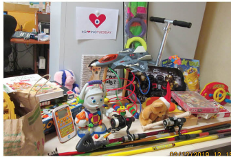
Clinique Médicale Brugnon Agache (70)

Du 18 novembre au 3 décembre 2019, salariés, patients, bénévoles et familles de la Fondation ont participé à une grande collecte de jouets au profit des enfants et adolescents des Instituts Perdrizet et Saint-Nicolas à Giromagny et Rougemont-le-Château (90).