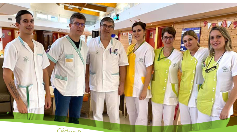
Cédric Perrin, sénateur, en compagnie de l'équipe soignante

La Fondation Arc-en-Ciel a eu le plaisir d'accueillir le Sénateur du Territoire de Belfort, Cédric Perrin, pour réaliser un "Vis ma Vie de soignant" dans notre EHPAD La Maison Blanche à Beaucourt (90).