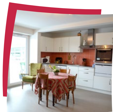
Cuisine meublée et équipée